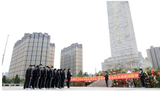
图 1：2022 年 4 月 5 日 党史学习教育暨祭英烈扫墓活动