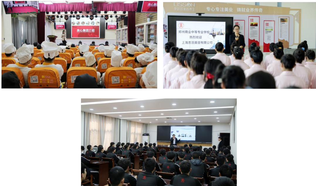
图 12：2022 年校企合作双选会