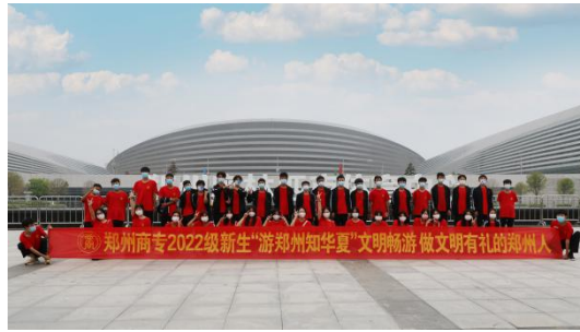
图 7：2022 年 9 月 18 日 学校组织开展“游郑州知华夏”游玩活动