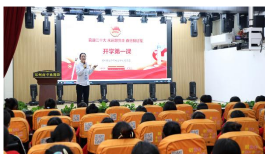
图 6：2022 年 9 月 7 日 学校组织开展新生开学第一课