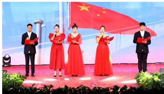
图 2：2022 年 5 月 15 日 《请党放心，强国有我》朗读比赛