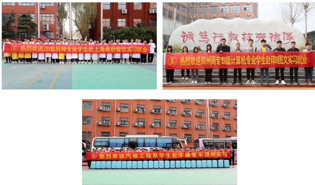
图 13：2022 年学生赴企业顶岗实习