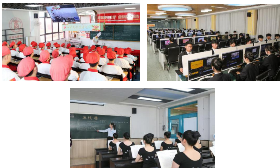
图 8：部分专业群展示

学校专业建设紧紧围绕服务郑州市建设国家中心城市的发展方向设置特色专业。建立了人才需求与专业设置动态调整机制，学校各专业均成立了由行业企业专家和本校骨干教师组成的专业建设委员会，进行了广泛而深入的调研，并根据调研结合学校实际情况，本年度不断对计算机应用专业群、中餐烹饪与营养膳食、音乐表演等品牌专业进行优化调整，主动适应产业经济升级的根本要求，注重学生实训实践能力培养。