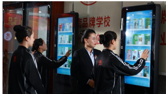
图 10：学校图书阅览室、电子图书阅览机