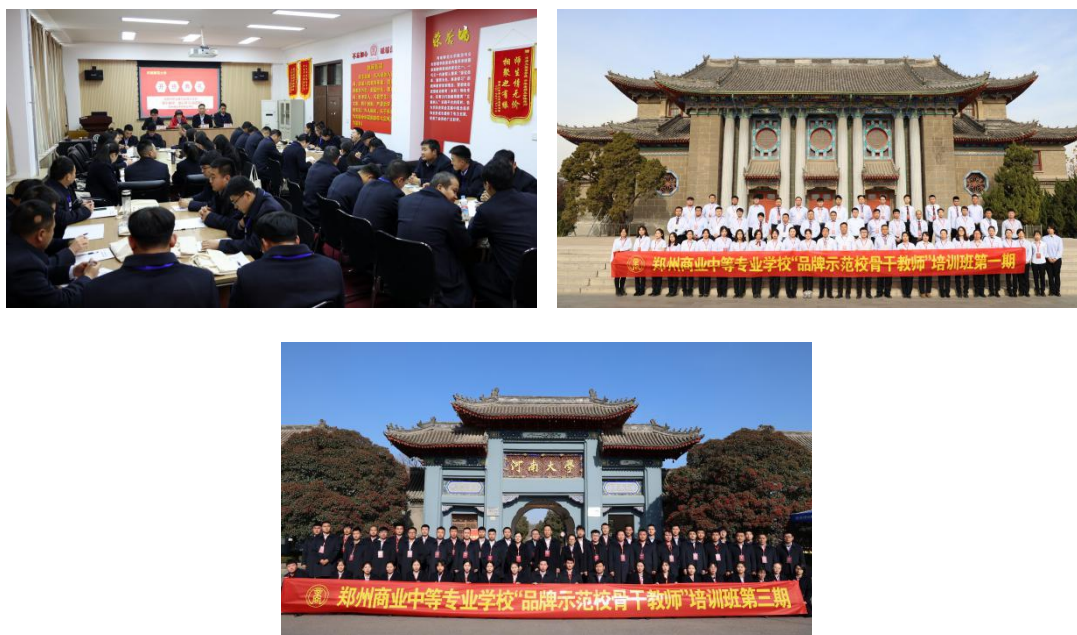
图 11：学校组织教师代表外出学习

事业铺路”。着眼于教师专业化和职业化发展，提高教师的业务技能和人文素养。学校一直坚持“请进来，走出去”培育优秀教师队伍的原则，每年邀请专家、教授、行业内高级技师等到学校进行讲座，选派青年教师到省内外高校进行学习，努力把学校打造成为学生有特长、教工有特技、办学有特点的特色学校。