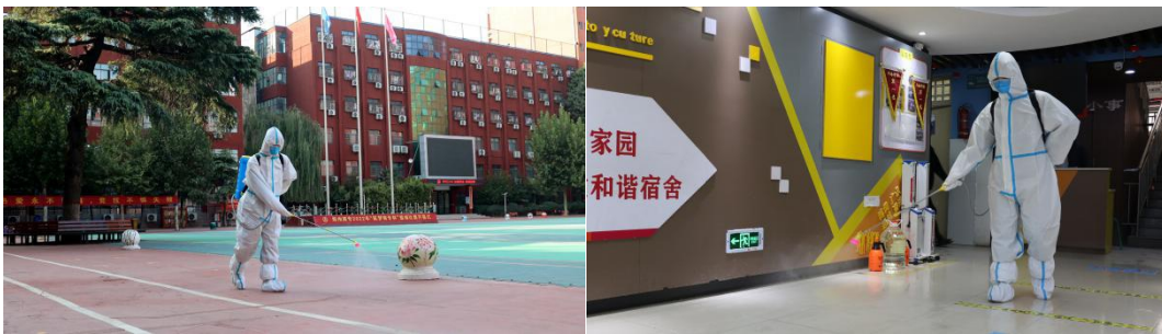
图 16：学校严格落实地方疫情防控政策

自 2022 年 10 月份以来，郑州及周边城市疫情形势严峻，学校严格落实郑州市疫情防控政策，启动疫情防控应急机制，全校师生静态管理，实施线上教学，按期全员核酸检测、备足消杀及生活物料等疫情防控各项措施。全体教职工入住学校、24 小时与学生同吃同住，做学生的领航员、引导员、服务员，保证能第一时间为学生提供帮助。