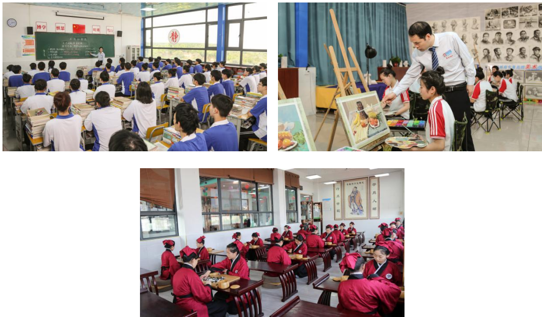
图 9：学校部分特色课程展示

学校积极构建特色课程体系，我们紧紧围绕学生升学的强烈需求，增设升学班、艺术高考方向的班级，立足升学我们开设了语文、数学、英语、政治、历史、地理、体育、计算机等公共基础课程，色彩、水粉、素描、音乐表演等专业基础课程，另外我们又增设了礼仪课、普通话、应用文、国学、书法等特色人文课程。