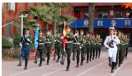
图 5：2022 年 9 月 7 日 学校组织开展新学期首次升旗仪式

学校以营造“校园无小事，事事皆育人；校园无闲人，人人皆育人；校园无空档，处处皆育人”的育人氛围，形成浓郁而健康的学风、班风、校风。同时，发挥家庭、学校、社会三位一体的教育网络作用，组建学生活动组织，通过丰富多彩的活动，陶冶学生情操、净化学生心灵，促进学生行为规范养成，达到身心和谐健康发展，真正做到让家长放心。