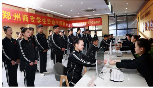
图 15：学生资助卡发放现场