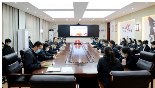
图 4：2022 年 10 月 16 日 党支部学习党的二十大习近平总书记讲话