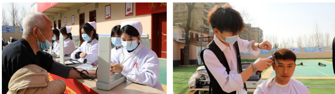
图 14：学校“我为民服务办实事”志愿服务活动