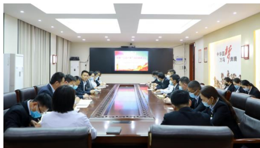
图 3：2022 年 6 月 30 日 “喜迎二十大·奋进新征程” 建党节活动